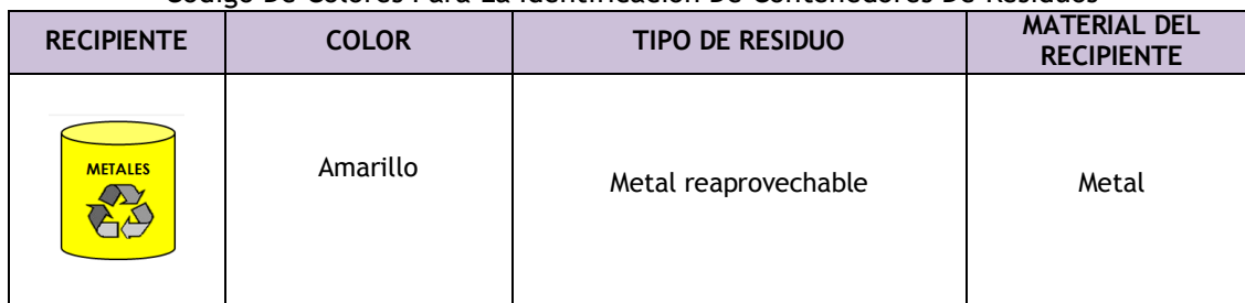
Tabla N° 7.1 Código De Colores Para La Identificación De Contenedores De Residuos